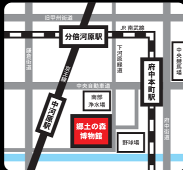
会場：府中市郷土の森博物館 （東京都府中市南町 6-32） 最寄駅：府中駅、分倍河原駅からバスで、 郷土の森総合体育館行き「郷土の森正門前」下車

9月24日、25日 ・一般入館料大人 200 円、中学生以下 100 円 ・プラネタリウム観覧料：大人 400 円、中学生以下 200 円 9月26日 ※事前申込制 ・参加費：3,000 円（8月31日まで） 4,000 円（9月1日以降） ・昼食弁当代：1,000 円 ・ドームフェスタ・パンケット：6,000 円